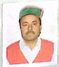
Photograph of Mortgagor. Loan Amount is Rs. 2,00,000/- NJS worth Rs. 100/-